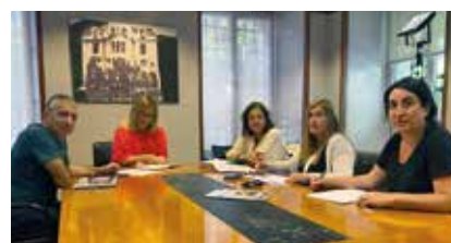
Con el Grupo Mixto.