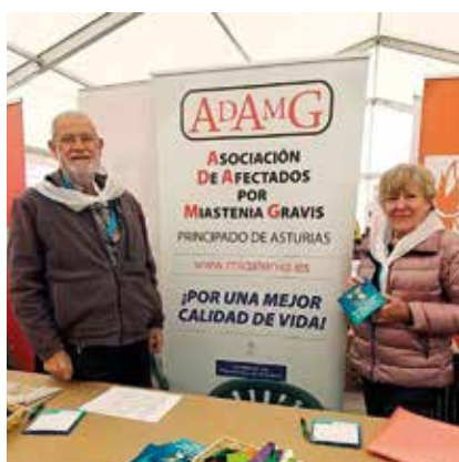
En la FAVA de Avilés.

Las actividades que desarrollamos a lo largo del primer semestre del presente año, tienen como principal objetivo, la mejora de la calidad de vida de nuestros asociados/as y, a la vez, focalizar la enfermedad y darle visibilidad en un marco social lo más amplio posible. Desde ADAMG, nos volcamos en la realización de estas