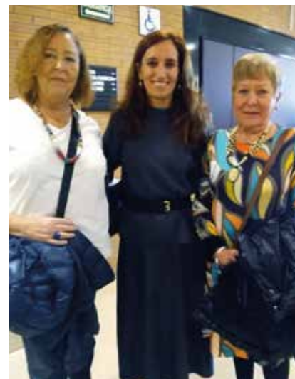
Evento sobre Enfermedades Raras en Sevilla.

3. Participación en las II Jornadas de Sensibilización y Difusión de las Enfermedades Raras o Minoritarias de Asturias.