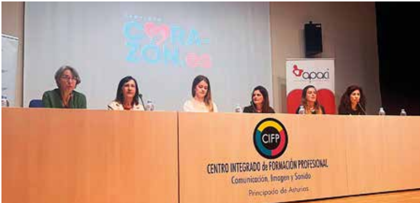
Presentación del proyecto "Corazones, un viaje a la resiliencia".

La sensibilización y el acercamiento de las cardiopatías congénitas a la sociedad, es muy importante, al tratarse de una patología que no es visible en un primer momento. En el año 2016, APACI colaboró con el Centro Integrado de Formación Profesional para la Comunicación, Imagen y Sonido de Langreo (CIFP CISLAN) en un proyecto que llevaba por título “Cremalleras”.