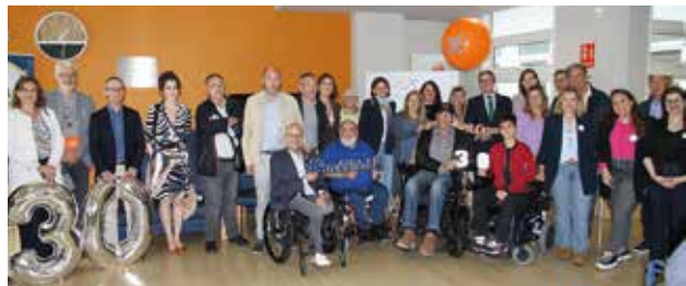
COCEMFE Asturias cumple tres décadas de andadura y lo celebramos con nuestras entidades