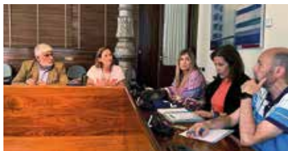
Con el Grupo del PSOE.