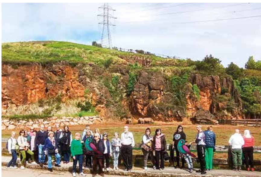
Jornada Cultural en Cabárceno.