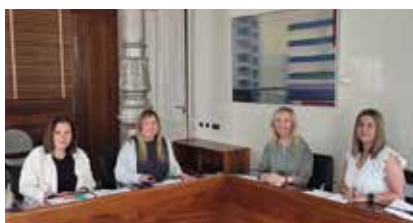
Con el Grupo de VOX.

Se solicita aprobar en esta legislatura la nueva Ley de Servicios Sociales, y una nueva normativa que regule la Accesibilidad Universal en nuestra Comunidad Autónoma, para actualizar la nueva normativa que ya resulta obsoleta.