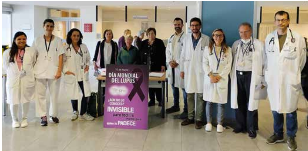
Mesa informativa en el HUCA.