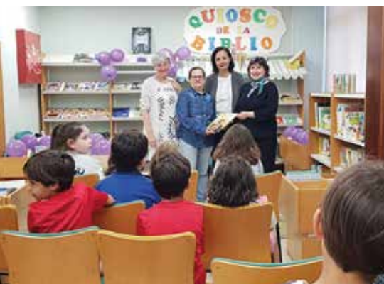
Cuentacuentos "El Mejor Paraguas del Mundo".

Nuestros lazos morados, prendieron apoyo en las solapas de quienes los portaron, dando proyección al Día Mundial del Lupus y visibilidad a todos los enfermos