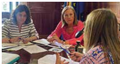
Con el Grupo del PP.