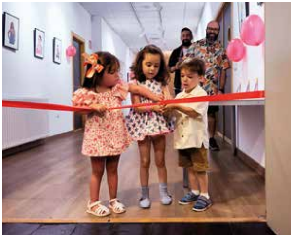
Corte de la cinta en la presentación de la exposición.

profundo del concepto de diversidad y su materialización en la vida diaria.