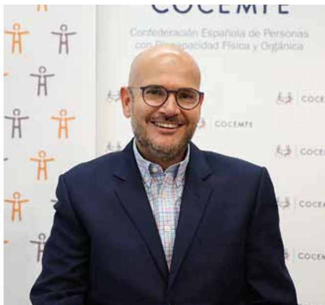
Anxo Queiruga, presidente de COCEMFE.

También, el Presidente, ha comentado las carencias del actual modelo de financiación, basado en subvenciones