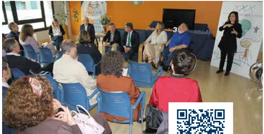
Ver el video del 30 Aniversario>>

Otro hito importante fue la puesta en marcha de la Oficina Técnica de Accesibilidad, OTA , en año 2007 y la Oficina de Vida Autónoma y Participativa, OVAP , en el año 2023. Además, varios programas, como el servicio de transporte adaptado, la asistencia personal, el programa de rehabilitación continuada “mejora”, en el año 2004 y un largo etc. Todo ello, buscando siempre el mismo objetivo,