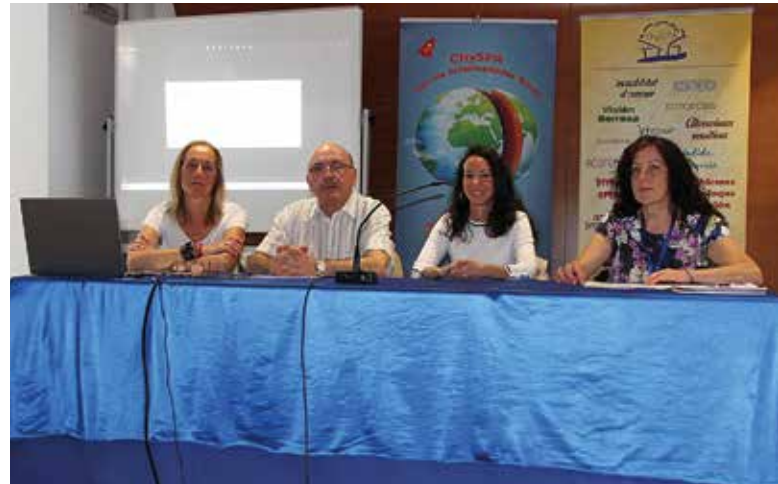
Charla "La importancia de la Atención primaria en el Chiari y la Siringomielia".