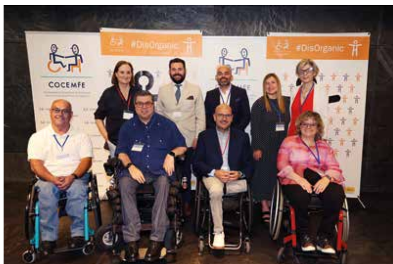
Equipo directivo de COCEMFE.

Otro punto importante durante la Asamblea, fue la aprobación del nuevo Plan Estratégico de COCEMFE para 2024-2028, basado en cuatro ejes de acción: el modelo de atención a las personas con discapacidad física y orgánica