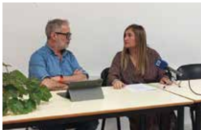
Intensa actividad política de cara a los presupuestos de Asturias 2025