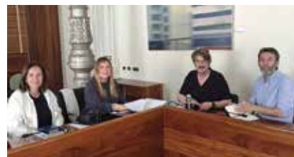
Con el Grupo de Convocatoria por Asturias.

COCEMFE Asturias se reunió con los Grupos Parlamentarios del PSOE, PP, Convocatoria por Asturias, VOX y Grupo Mixto con el objetivo de trasladar y debatir asuntos importantes y necesarios para nuestra entidad, las asociaciones a las que representamos y nuestros/as asociados/as, de cara a la preparación de los presupuestos del Gobierno del Principado de Asturias para el año 2025.