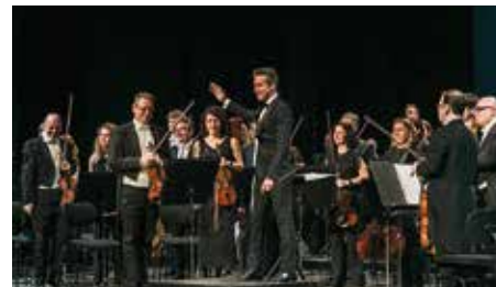
Oviedo Filarmonía se vuelca con COCEMFE Asturias en su 25 aniversario