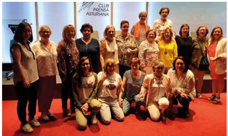
Presentación en la sala de prensa de La Nueva España el proyecto AENFIPA Online.