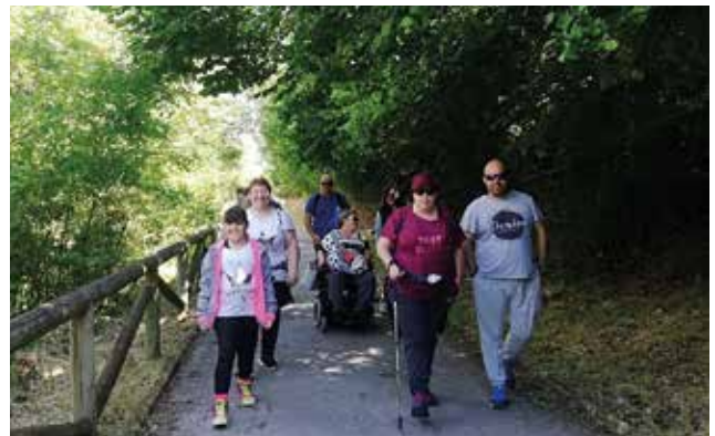
Salida lúdica: Ruta accesible de la Senda del Oso.

La Jornada dio término llena de buenas expectativas, con el convencimiento de la necesidad de trabajar para lograr un manejo integral, multidisciplinar y uniforme de los enfermos de Chiari, Siringomielia y patologías asociadas.