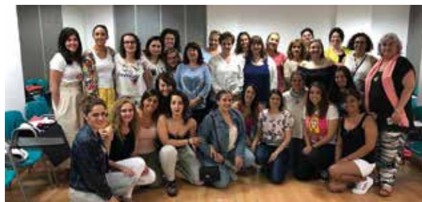
Participantes en el 1º Encuentro de mujeres portadoras de hemofilia celebrado en Málaga.

En este encuentro se abordaron temas de interés para la mujer portadora, como pruebas diagnósticas, problemas hemorrágicos en portadoras sintomáticas, consejo genético, maternidad, redefinición del concepto de portadora o temas tan sensibles