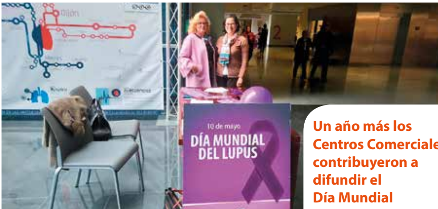
Mesa informativa en el HUCA.

El 10 de mayo se celebró el Día Mundial del Lupus. ALAS ha querido colaborar con la difusión de nuestra afectación con varias acciones: por un lado nos unimos al #retomariposa en las redes sociales, animando a nuestros socios y seguidores a subir fotos bajo ese hastag.