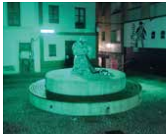
Plazoleta de la Redera, Candás.

La Comunidad de la ELA trabaja en conjunto para mejorar la calidad de vida de las personas afectadas de ELA (enfermos y familiares) e impulsar la investigación sobre la enfermedad. Nuestro agradecimiento a los consistorios que se han sumado a la iniciativa por su colaboración.