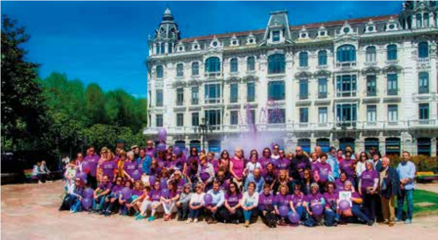
El día 12 de mayo se leyó un manifiesto reivindicativo en la Fuente de la Escandelería en Oviedo.

Como cada año, el día 12 de Mayo se celebró el día Internacional de la Fibromialgia y una vez más hemos realizado una serie de actividades.