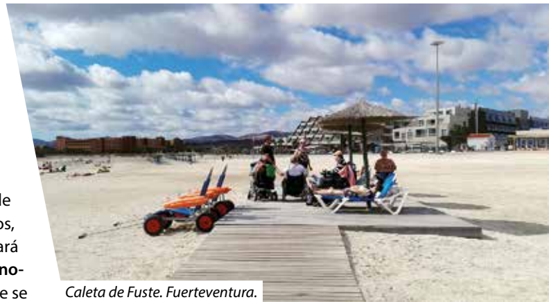
Caleta de Fuste. Fuerteventura.

Han viajado con COCEMFE más de 42.000 personas