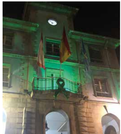
Iluminación en el Teatro Campoamor y el Ayuntamiento de Carreño.