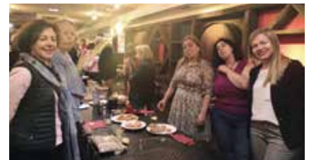
Espicha del Día del Socio/a.