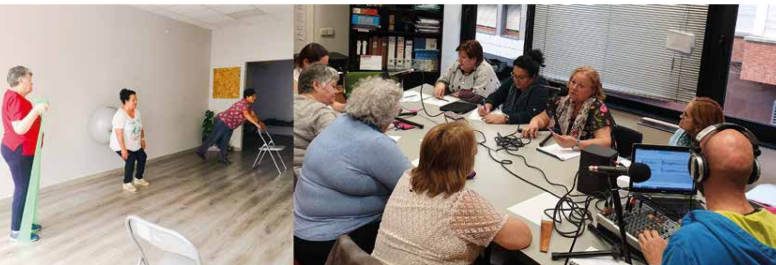
Deporte adaptado y la emisión del programa de radio AMDAS LA FONTE: Un mundo nuevo'.