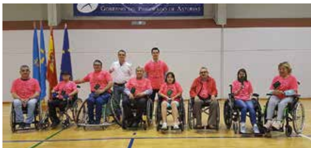
Ganadores en la modalidad Bola 8 en silla de ruedas.

El pasado 14 de junio DIFAC celebró el XXI Campeonato de billar y X de Asturias adaptado, en su modalidad bola ocho en silla de ruedas, en el Polideportivo Municipal de Los Campos (Corvera de Asturias). La finalidad de esta actividad lúdica y deportiva es el acercamiento entre personas con discapacidad y sin ella.