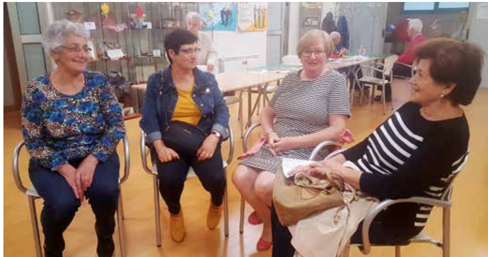
La familia es el principal proveedor de cuidados y atenciones de la persona dependiente.

El aumento de la esperanza de vida y los avances en la medicina han hecho que en la actualidad los cuidadores atiendan a sus familiares dependientes durante un largo periodo de tiempo y