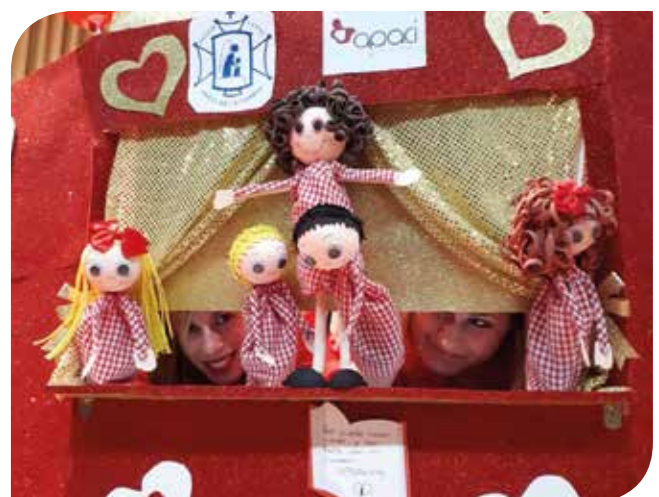
Teatrillos y cuentacuentos como instrumento para sensibilizar a la población escolar sobre las cardiopatías congénitas.

Es innegable que la escolarización es un factor clave en el desarrollo psicomotor, afectivo, cognitivo y social de la persona, especialmente en las situaciones en las que se ha de hacer