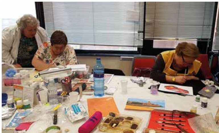
Taller de terapias manuales en el local de la Asociación.